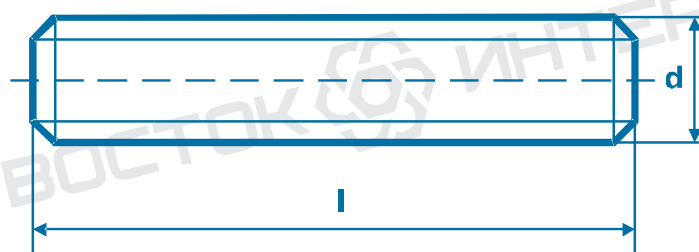
Рисунок 2: Размеры шпилек Тип В (обозначение)

Тип В , форма концов резьбы тип CH согласно DIN EN ISO 4753